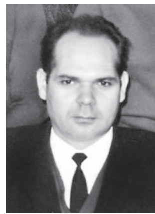
Рис. 9. Віктор Романович Сорока (1930—2002)