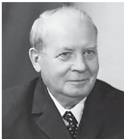
Рис. 5. Іван Іванович Потоцький (1898—1978)