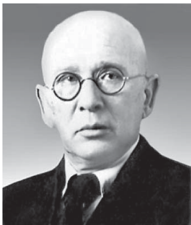
Рис. 4. Марк Тимофійович Бриль (1889—1967)